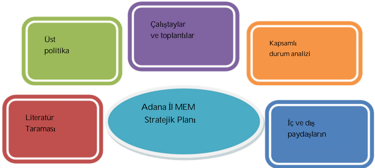
Şekil 1 :Stratejik Planlama Modeli

Stratejik planlama uygulamalarının başarılı olması, önemli ölçüde plan öncesi hazırlık çalışmalarının iyi planlanmış olmasına ve sürece katılımın üst düzeyde sağlanmasına bağlıdır.